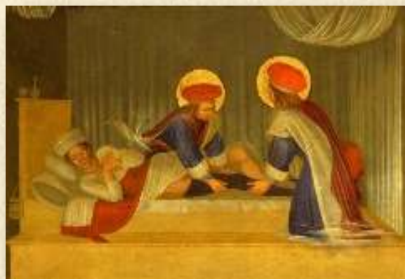
Beato Angelico, "Il mito dei Santi medici Cosma e Damiano", tratto da Nicola Picardi, Chirurgia sperimentale e dei trapianti d'organo: storia, metodologie e conquiste tecnologiche , Roma, 2013, SBMS 617.9 CHISED