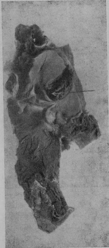
Fig. 2. — Valvole aortiche. — Il conglomerato tubercolare si affaccia al disopra della valvola posteriore.

Cavità toracica. — Cuore spostato a sinistra. Le superfici e i due foglietti del pericardio sono tenacemente fusi in una corazza fibrosa, che avvolge il cuore con conseguente obliferazione del cavo pericardico ed interessamento del tessuto cellulare del mediastino. Il volume del cuore è leggermente aumentato. Al taglio si nota che le cavità ventricolari sono ampiamente dilatate ed il muscolo è modicamente ipertrofico e di colorito bruno-rossastro. Eseguita l'apertura, si constata che l'endocardio è lievemente opacato, ma non presenta proliferazioni vegetanti o erosioni sulle valvole atrioventricolari e semilunari, nè sulla parete dei ventricoli e degli atri, nè sono evidenziabili alterazioni a carico