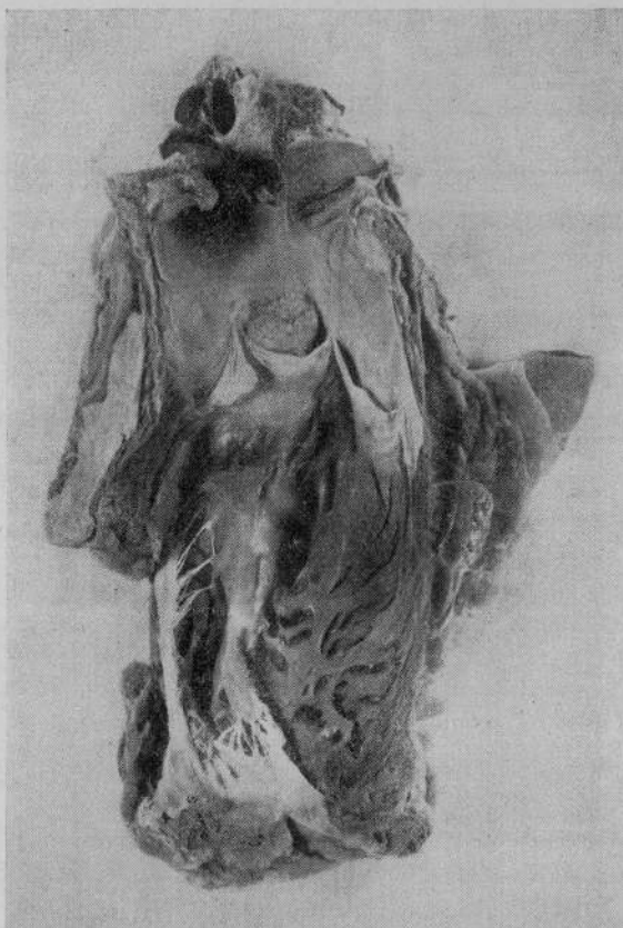
Fig. 1. — Valvole polmonari. — Il conglomerato tubercolare vegetante sporge subito al disopra del seno anteriore.

Diagnosi clinica. — Esiti di pleurite bilaterale. Sepsi. Endocardite acuta (?)