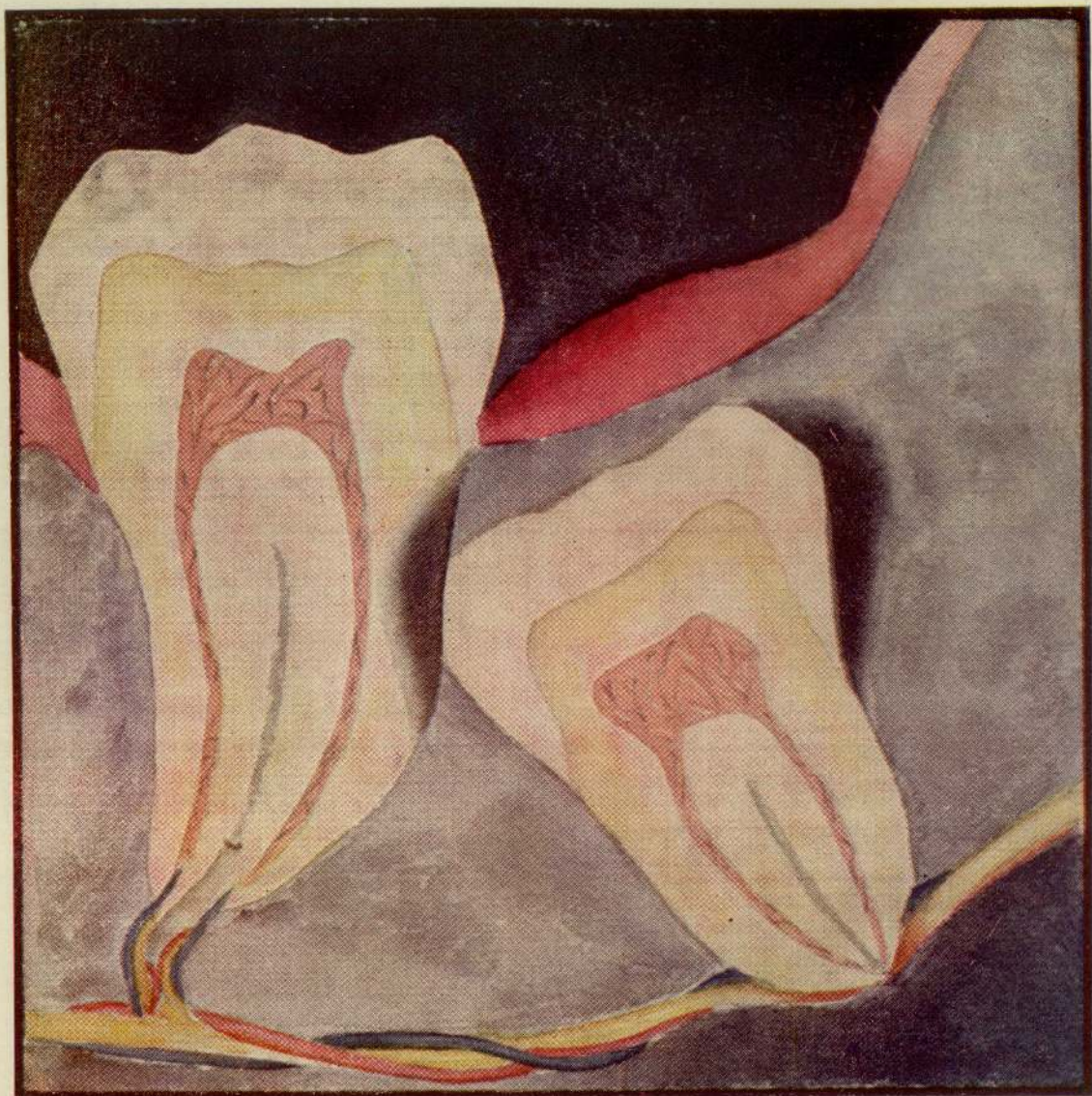
Inclusione del terzo mandibolare con flogosi del cappuccio mucoso e del cul di sacco distale corrispondenti, compressione del fascio nerveo-vascolare mandibolare per inclinazione dell'apice radicolare, alisteresi da compressione del cemento del settimo